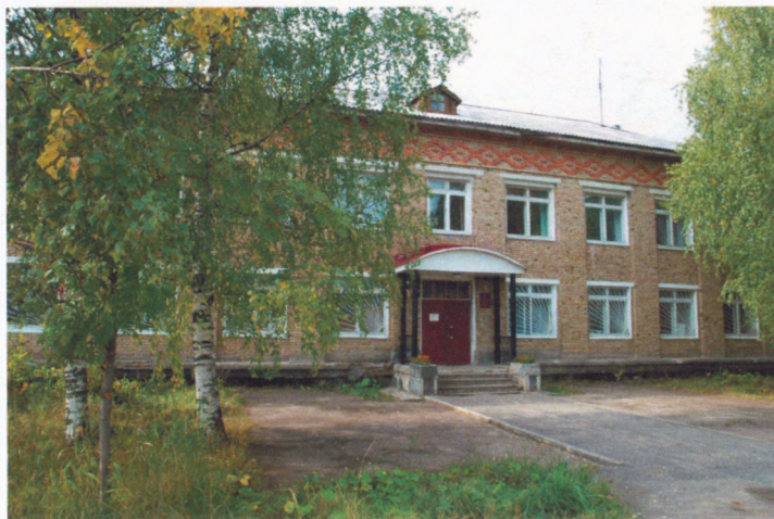
Здание бывшего райкома КПСС, с ноября 1991 года находится Корткеросская центральная библиотека (ул.Советская, 187)

В 1991 году освобождается здание райкома партии (ул. Советская, 187). По распоряжению Корткеросского райисполкома часть первого этажа переходит Центральной и Детской библиотекам.