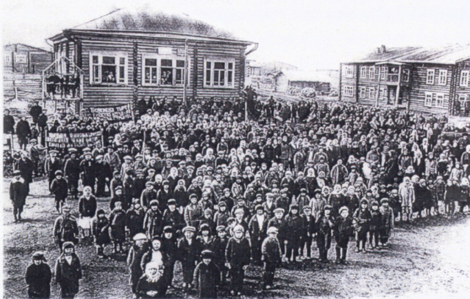
Здание Корткеросского волостного правления. Построено в 1912 году. Здесь с 1916 по 1930 - е годы размещалась библиотека

К 1917 году читателей в библиотеке заметно прибавилось, посетители стали мешать учебному процессу. Было принято решение перевести библиотеку из начального училища в здание волостного правления.