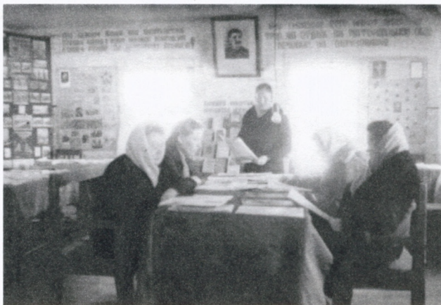
Интерьер библиотеки 1947 – 1949 гг.

вид, в избе-читальне, велась активная работа: проводились политинформации, беседы, был оформлен уголок «Что читать по обороне страны».