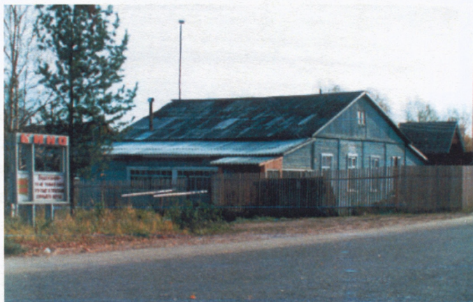
В этом здании (ул.Советская, 120) библиотека размещалась с 1978 по 1991 год

1978 год. Два года после пожара прошли в переездах из одного помещения в другое. Наконец библиотеке выделили отдельное здание.