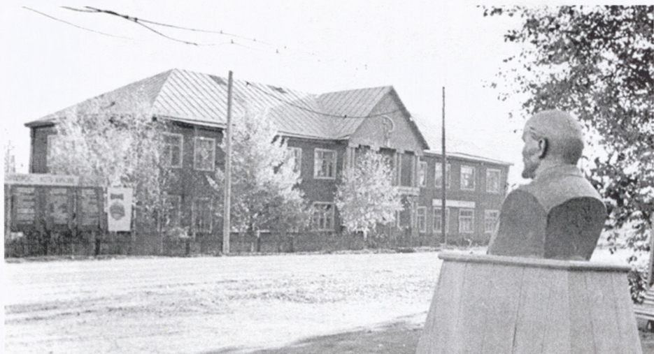
Здание Дома культуры, построенного в 1953 году и сгоревшего в 1976 году (левое крыло 1 и 2-й этажи занимала библиотека, ул. Советская)

В 1953 году открыл двери новый Дом культуры, библиотеке отводится левое крыло здания. Отдел обслуживания библиотеки разместился на втором этаже и занимал две большие комнаты. Детское отделение библиотеки к этому времени работало самостоятельно и занимало первый этаж. В этом же здании размещались кинофикация, музей.